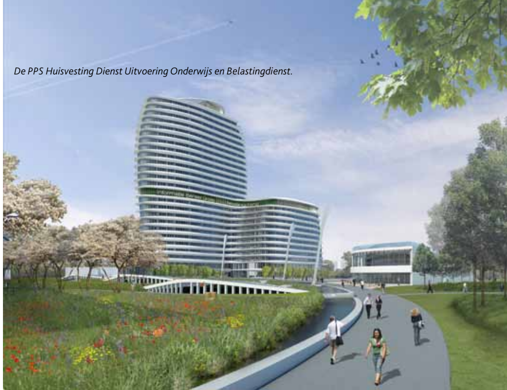
De PPS Huisvesting Dienst Uitvoering Onderwijs en Belastingdienst.

De MO-manager zorgt voor een vlekkeloze transitie van de DB-fase naar de MO-fase. Tijdens de verschillende fasen zal hij het proces dusdanig managen dat bij ingebruikname van het gebouw de functies en functionaliteiten efficiënt en effectief zijn ingericht. Dit gehele proces bestaat uit vier fasen: de ontwerpfase, de voorbereidingsfase, de transitiefase en de uitvoeringsfase (zie figuur 1).